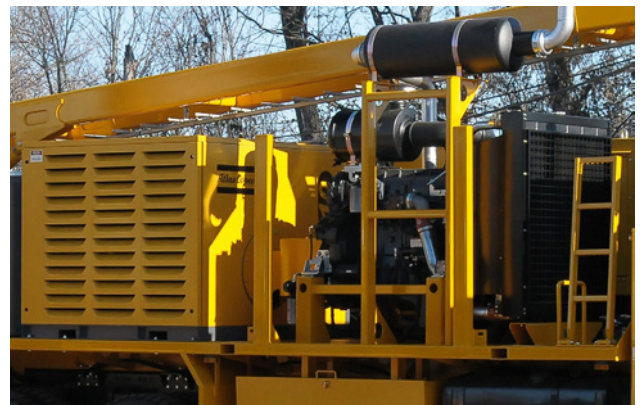
Compresore d'aria Air compressor Compresneur d'aire Kompressor Compresor de aire