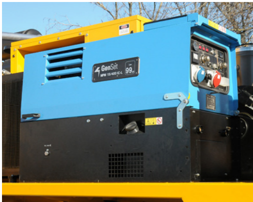
Saldatrice Welding machine Soudeuse Schweißer Soldadora